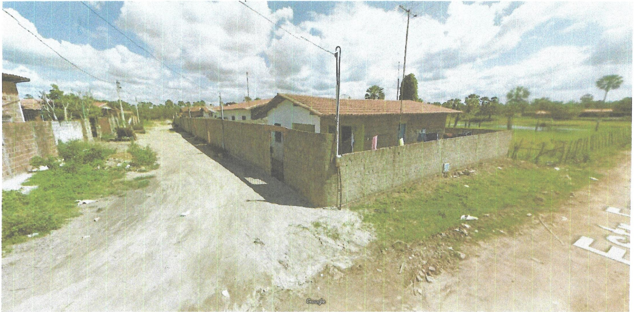
Captura da Imagem: Jun 2012 © 2019 Google