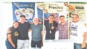
CARAVANA CSP, NO PECÉM - 2019