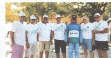
LIMPEZA DA PRAIA DO PECÉM - 2019

Sem mais, assinam este documento as entidades abaixo: