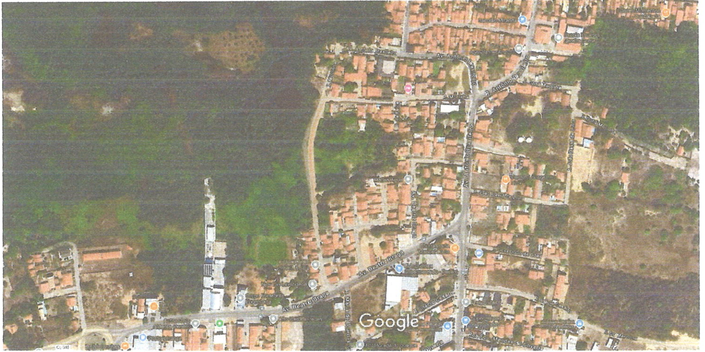
Imagens ©2025 Airbus, Maxar Technologies, Dados do mapa ©2025 50 m

A rua sem nome, conhecida popularmente como "Rua da Foice", é uma via de terra batida que se estende como continuação da Rua Mocinha. Sendo